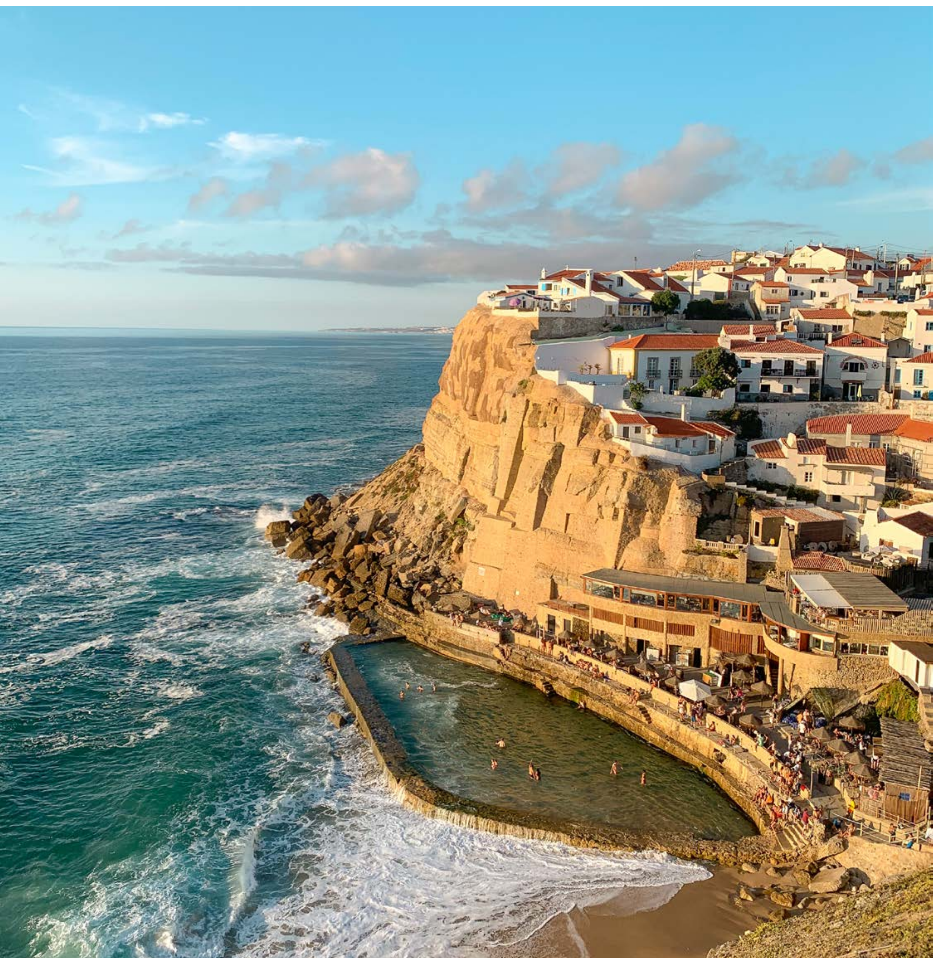
Azenhas do Mar, Sintra